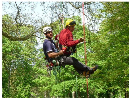
Avril 2011, échanges et validation des techniques de sauvetage, Le Tremblay-sur-Mauldre, Yvelines

La première formation de formateur GSST s'est tenue en octobre 2014 à Tours-Fondettes, la seconde en février 2015 à Châteauneuf-du-Rhône.